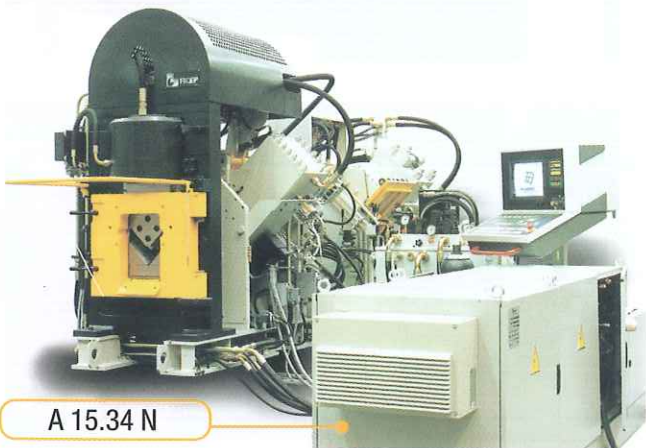
A 15.34 N