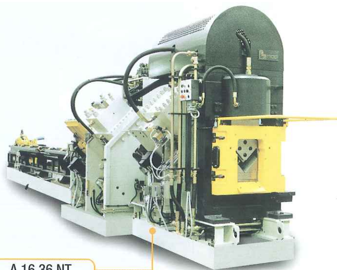
A 16.36 NT